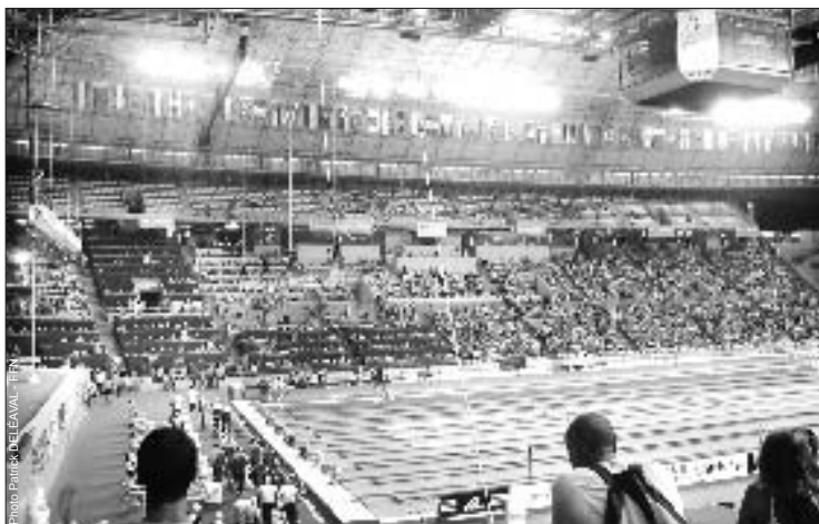
En l'espace de huit jours de compétition, le bassin de 50 m du Palau Sant Jordi a enregistré l'amélioration de treize records du monde, soixante records continentaux, dont huit d'Europe, trente-huit records des championnats et onze records de France.