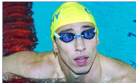
Et de quatre pour Frédéric Bousquet qui, avec sa course victorieuse sur 50 m papillon, engrange une quatrième médaille d'or à ces championnats.