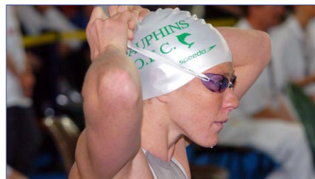
Médaillée de bronze olympique sur la distance, Solenne Figuéas a repoussé les assauts de Laure Manaudou sur sa course fétiche, le 200 m nage libre.