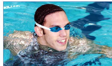
Inamovible dans son premier rôle au 100 m brasse depuis l'édition des Championnats de France de 2001, Hugues Duboscq, bronzé sur cette discipline à Athènes, n'a eu aucun mal à poursuivre son règne.

Le complément du podium national a été complètement inédit avec le Rennais Yann Croissant, en argent, et le Bordelais Marc Lafosse, en bronze. Le sympathique brasseur sénégalais Malik Fall, licencié au Lyon Natation, a signé le deuxième chrono de cette finale, 1:03.34, tout près du record du Sénégal.