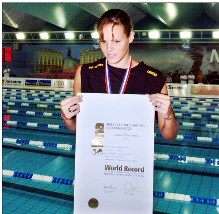
Championne olympique du 400 m nage libre, recordwoman du monde du 1500 m nage libre en bassin de 25 m, Laure Manaudou a enluminé les France 2005.