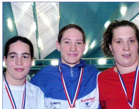
Large sourire pour Camille Muffat qui n'a pas laissé passer l'occasion d'engranger un second titre national en gagnant le 50 m brasse, devant Estelle Nolot (à gauche) et Delphine Leprest (à droite).

On attendait Anne-Sophie Le Paranthoën pour un probable triplé en brasse et c'est la toute jeune Camille Muffat, championne de France la veille au 200 m 4 nages, qui a soufflé la politesse aux sept rivales de la finale du 50 m brasse.