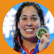
Ranomi Kromowijoko Championne olympique