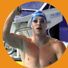
Andrei Govorov Recordman du monde