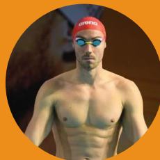
Jérémy Stravius Champion du monde