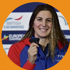
Charlotte Bonnet Championne d'Europe