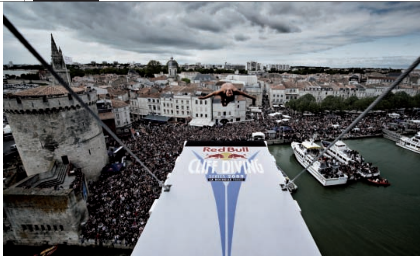
Plus de 30 000 personnes se sont massées le 8 mai 2009 au pied de la Tour Saint-Nicolas de La Rochelle pour assister à la première étape de Cliff Diving organisée en France.