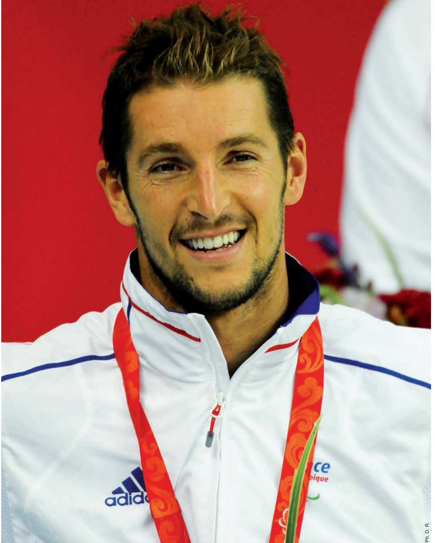
Ph. D. R.