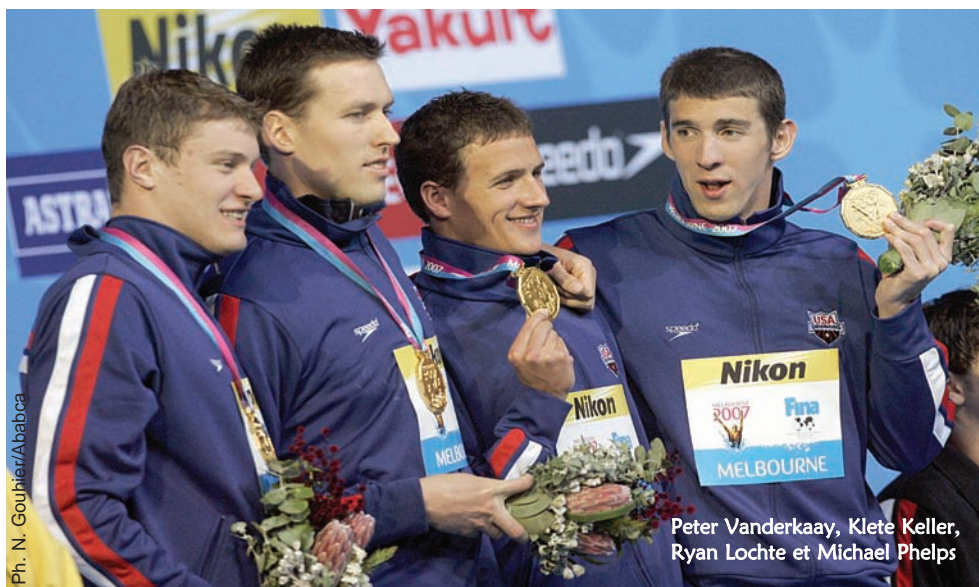
Peter Vanderkaay, Klete Keller, Ryan Lochte et Michael Phelps

▲ La course du siècle. Aux Jeux Olympiques d'Athènes en 2004, beaucoup estimaient que l'affrontement entre l'Australien Ian Thorpe, le Néerlandais Pieter Van den Hoogenband et le jeune prodige américain Michael Phelps sur 200 m nage libre constituait la course du siècle. Mais de course, il n'y en eut pas vraiment tant la suprématie de VDH était à l'époque incontestable. En 2007, le Néerlandais de retour de blessure et l'Australien retraité n'ont pas été en mesure de contrarier la quête de Michael Phelps. Le verdict est sans appel : médaille d'or et record du monde en 1'43"86 (ancien 1'44"06 par Ian Thorpe). "Je savais que Pieter allait partir vite, note l'Américain. J'ai donc attaqué dès le premier 100 m pour être à sa hauteur ou devant lui et utiliser toute ma vitesse."