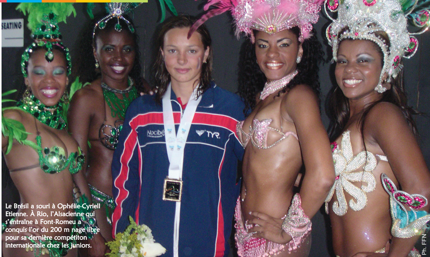
Le Brésil a souri à Ophélie-Cyriell Etienne. À Rio, l'Alsacienne qui s'entraîne à Font-Romeu a conquis l'or du 200 m nage libre pour sa dernière compétition internationale chez les juniors.