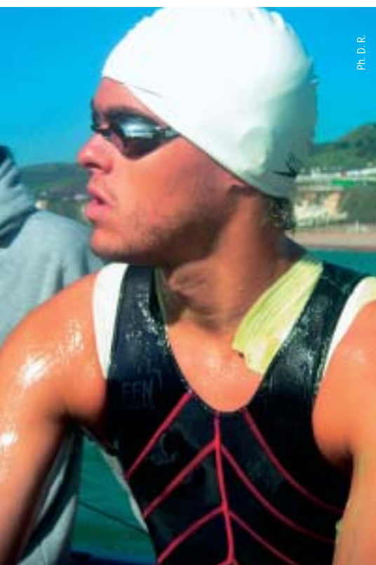
Ph. D. R.

Tous les résultats dans le cahier en pages centrales.