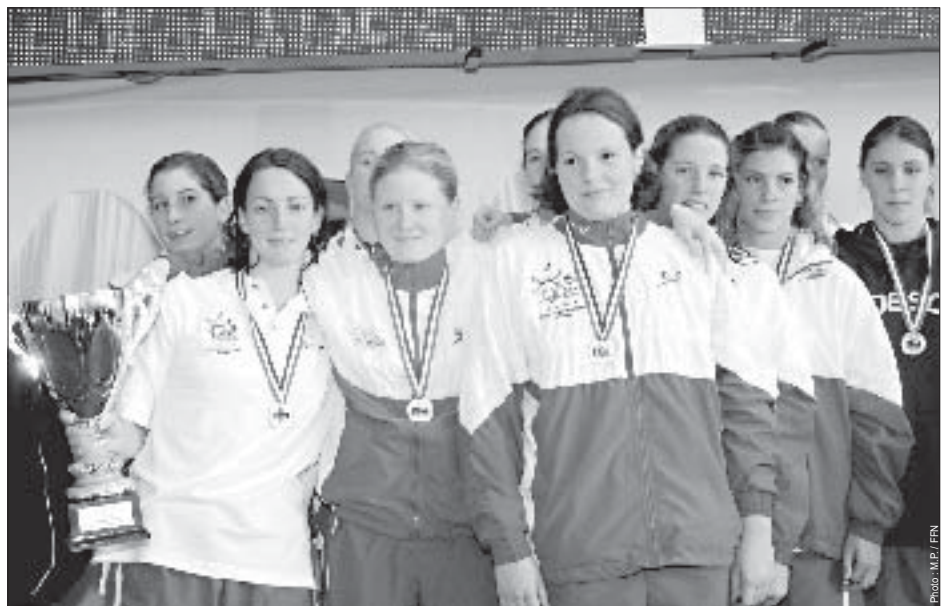
Malheureuse l'an dernier de son éviction de la N1 A, l'équipe dames du CN Antibes a pris sa revanche à Chalons-sur-Saône.

Nouvelle structure portée sur les fonts baptismaux la saison précédente, Lille Métropole Natation a réussi son entrée dans la Nationale 1 B, à la quatrième place.