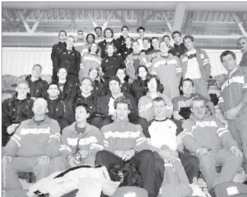
Sur l'ensemble des quarante et une nations présentes, vingt-quatre ont accédé au podium des Euro 2003 en bassin de 25 m. L'équipe de France, ici au complet avec son encadrement, émerge à la huitième place au classement des médailles, juste derrière la Russie.

C'est l'année des Jeux et toutes les autres échéances avant le rendez-vous à Athènes ne constituent qu'une mise en bouche. Le meilleur est à venir.