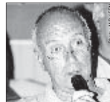
Par Jean-Paul NARCE adjoint au DTN pour l'eau libre