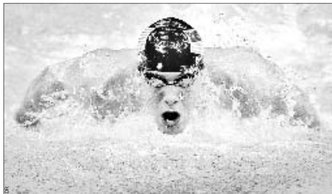
Surdoué du 4 nages et papillonneur d'exception, Michael Phelps possède encore une marge de progression en améliorant sa brasse.