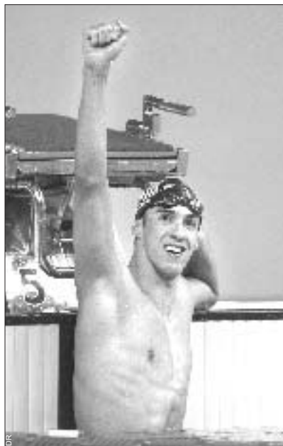
Mieux que Mark Sptiz aux JO de Munich, selon le nombre de records du monde battus au cours d'une même compétition, Michael Phelps annonce la prochaine évolution du 4 nages.

Le tableau I résume tous les pourcentages des six records du monde du 200 m 4 nages (4) et du 400 m 4 nages (2) battus au cours de l'année 2003.