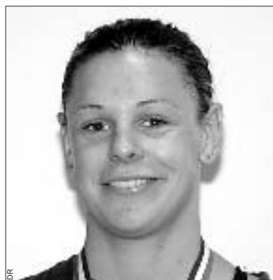
Championne d'Europe juniors du 100 m dos comme Laure Manaudou, l'an passé, à Linz (Autriche), la Provençale a pris sa succession sans aucun complexe.