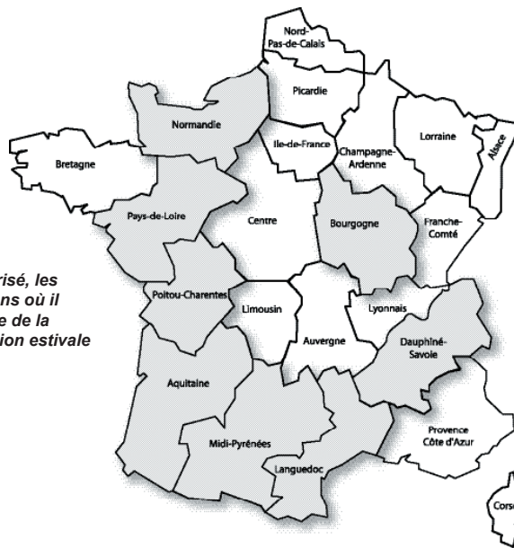
En grisé, les régions où il existe de la natation estivale