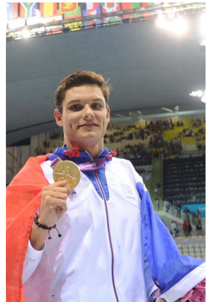
Florent MANAUDOU Champion olympique du 50 m nage libre Londres, le 3 août 2012