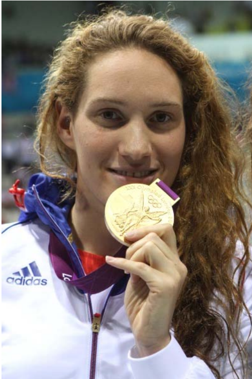
Camille MUFFAT Championne olympique du 400 m nage libre Londres, le 29 juillet 2012