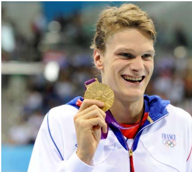
Yannick AGNEL Champion olympique du 200 m nage libre Londres, le 30 juillet 2012