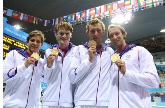
Relais 4x100 m nage libre Champions olympiques Clément LEFERT, Yannick AGNEL, Amaury LEVEAUX et Fabien GILOT + Alain BERNARD et Jérémy STRAVIUS Londres, le 29 juillet 2012